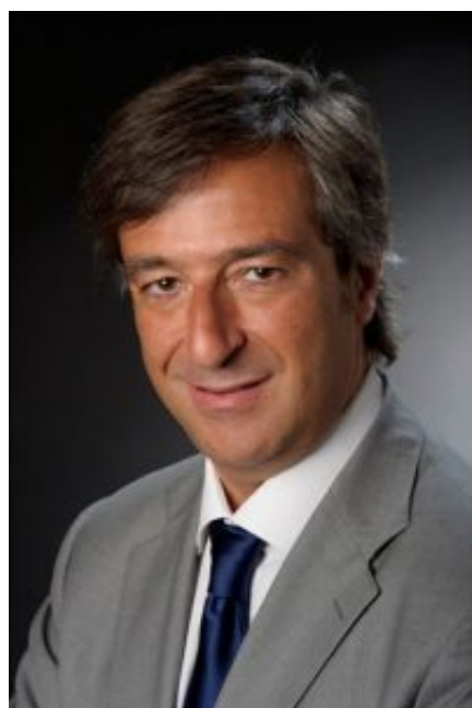
Dott. Nino Cartabellotta

“Nell’ultima settimana - afferma Nino Cartabellotta, Presidente della Fondazione GIMBE - si conferma l’incremento di oltre il 60% dei casi attualmente positivi che si riflette sul numero dei pazienti ricoverati con sintomi e in terapia intensiva, portando gli ospedali verso la saturazione. Questo impatta anche sul numero di decessi, che nell’ultima settimana ha superato quota 1.700 con un trend che, con una settimana di ritardo, ricalca di fatto le altre curve. L’ulteriore incremento