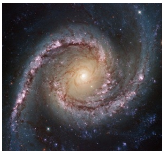
Immagine della galassia a spirale NGC 1566 presa dal Telescopio Hubble

Le braccia che avvolgono il nucleo di questa interessante formazione celeste infrangono la terza legge di Keplero per cui la velocità orbitale decresce con la distanza dal centro. Per spiegare questo fenomeno si ipotizzano la materia oscura o una correzione della seconda legge di Newton. Un team internazionale composto da ricercatori dell'Isc-Cnr e del Laboratoire de Physique Nucleaire et de Hautes Energies di Parigi apre la strada a ipotesi diverse, dimostrando come sia possibile simulare al computer la nascita di una galassia a spirale. Lo studio è pubblicato su The Astrophysical Journal